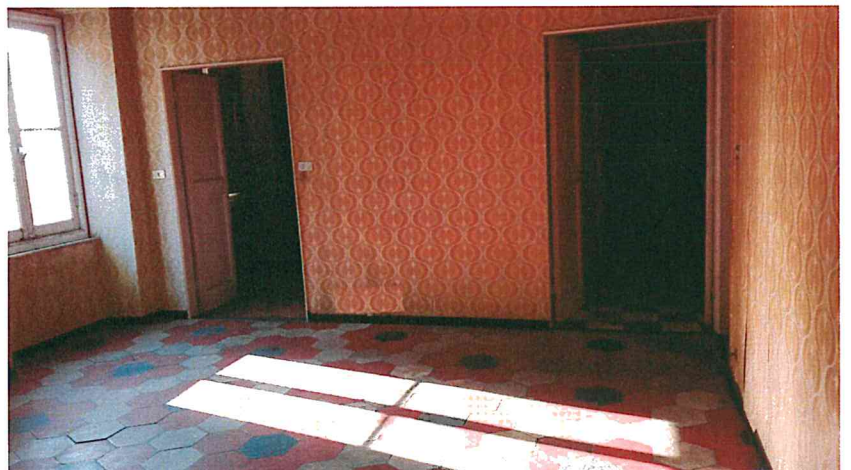
Foto 3 - Soggiorno