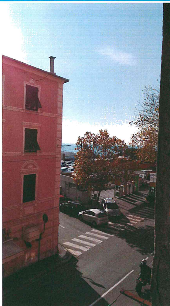
Foto 7 Vista dal lato sud