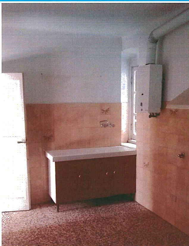
Foto 6 Cucina