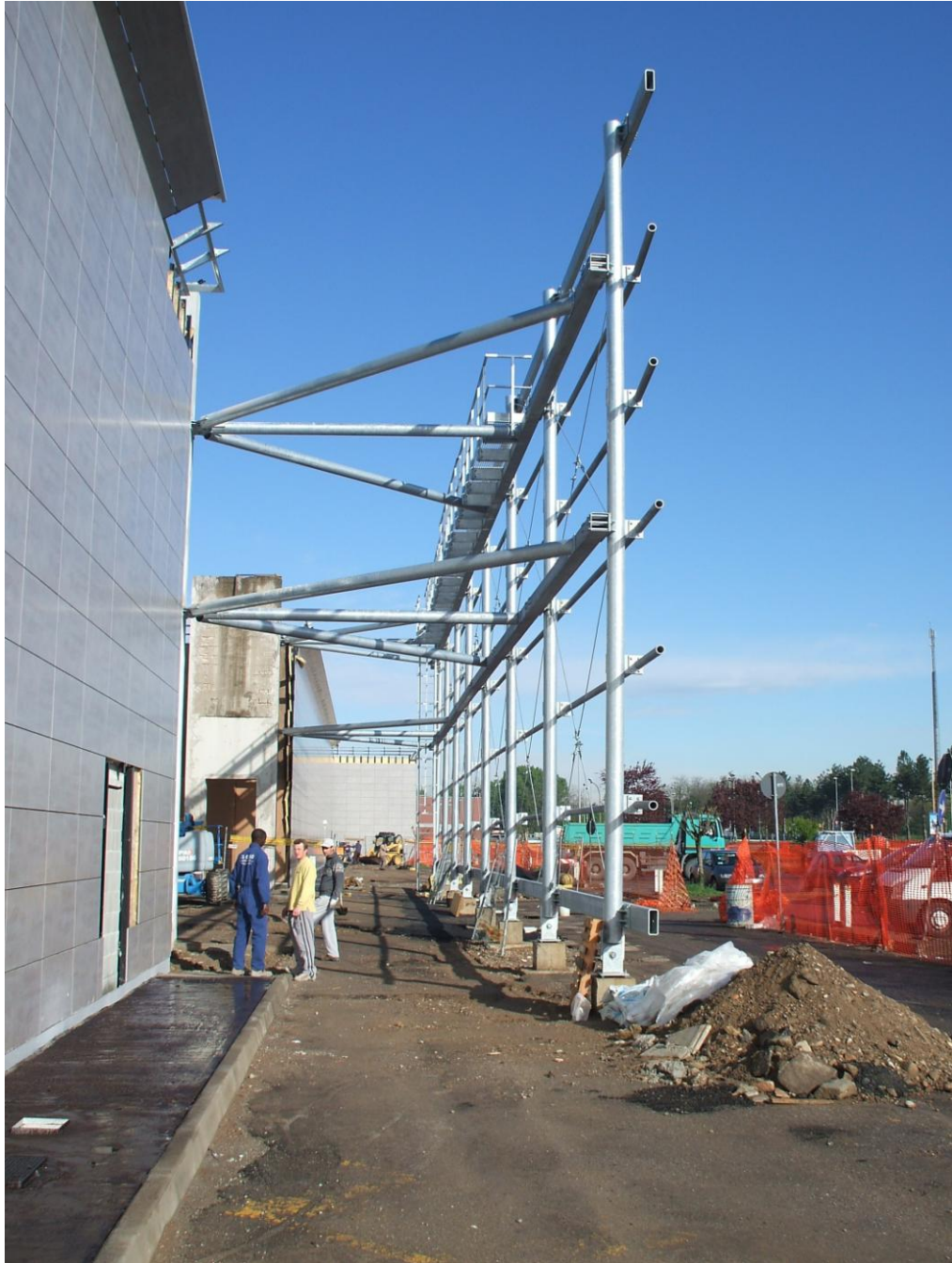
FOTO 02 – Luglio 2008 - Ampliamento e ristrutturazione del centro commerciale di Rhocenter a Rho (MI) - strutture metalliche dei pannelli pubblicitari.