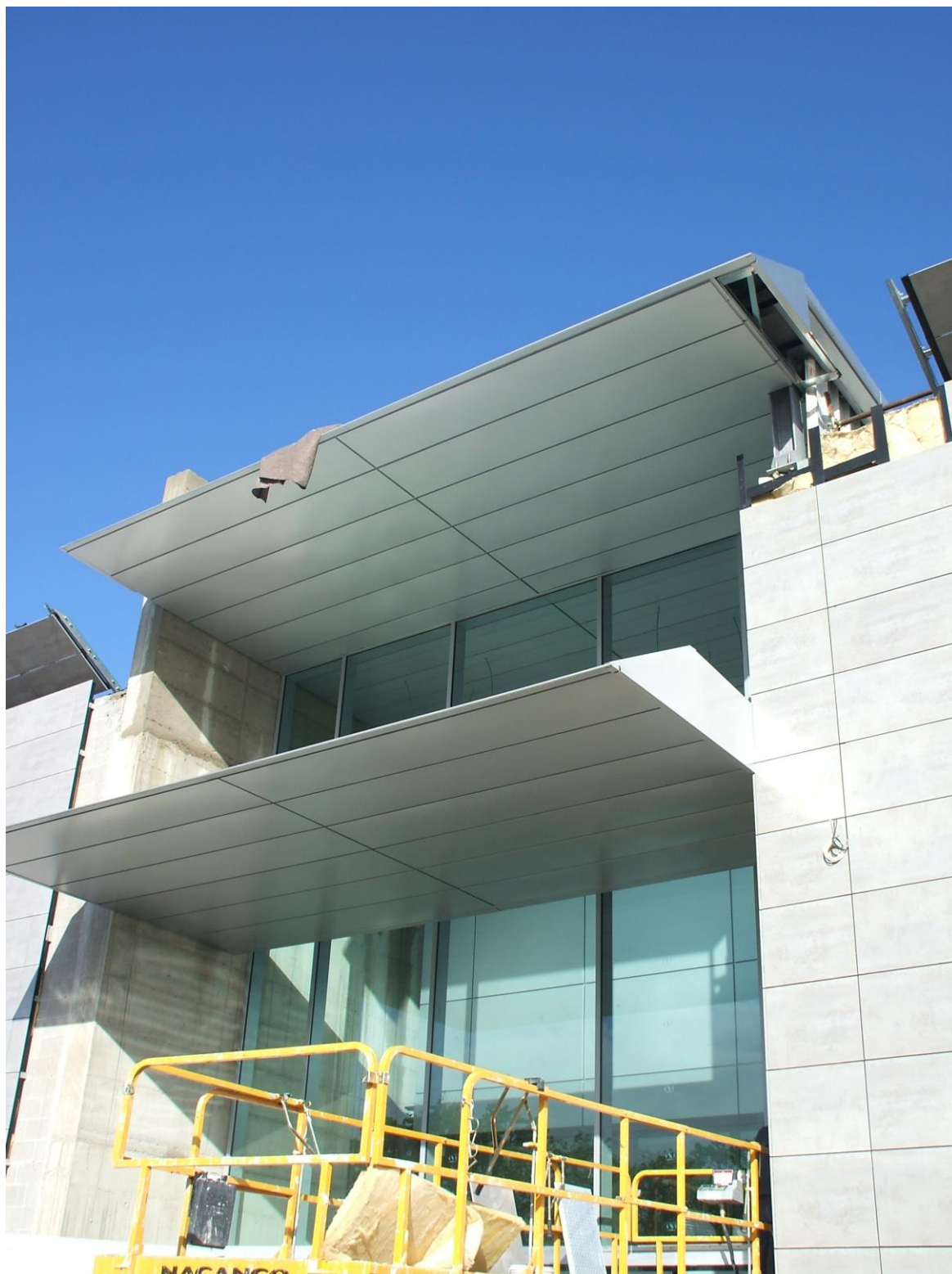
FOTO 03 Luglio 2008 - Ampliamento e ristrutturazione del centro commerciale di Rhocenter a Rho (MI) - Aprile 2008 - pensiline all'ingresso del centro commerciali eseguite con struttura metallica