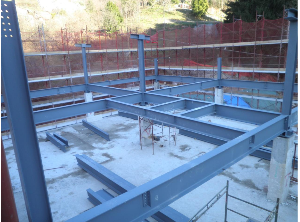
Foto 09 – Dicembre 2011 – Sopraelevazione e cambio di destinazione d'uso dell'ex biscottificio Delfino a Mignanego. Nuovo solaio sottotetto in travi metalliche e lamiera grecata (ancora da montare).