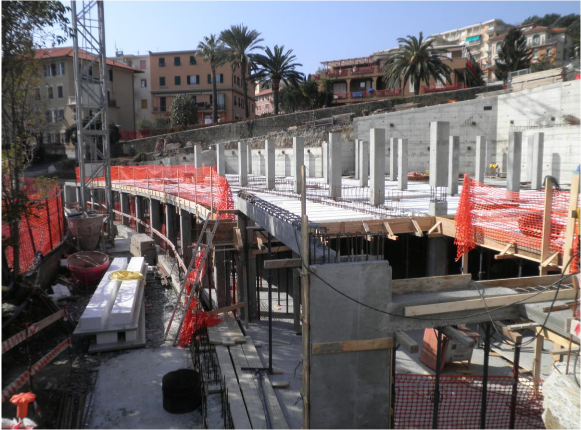
Foto 08 – Marzo 2012 - Realizzazione di autorimessa interrata ed immobile residenziale ad Arenzano – Fase di posa del secondo solaio in elevazione e dei pilastri a sostegno del terzo.