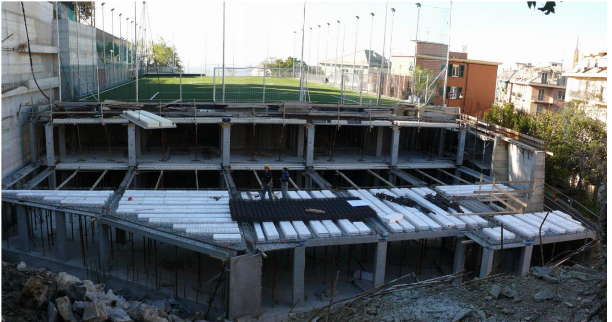
FOTO 04 – Ottobre 2011 - Realizzazione di autorimessa interrata con riqualificazione del campo da calcio a Genova Oregina -- Vista delle strutture in c.a. durante i lavori