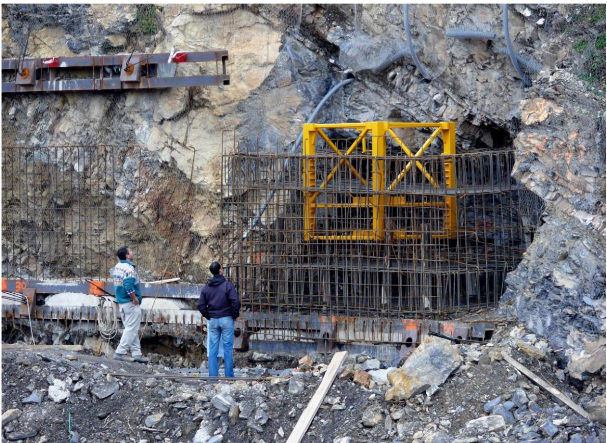
FOTO 04 – Dicembre 2009 - Realizzazione di autorimessa interrata con riqualificazione del campo da calcio a Genova Oregina — Realizzazione basamento per gru a ridosso del previsto fronte di scavo.