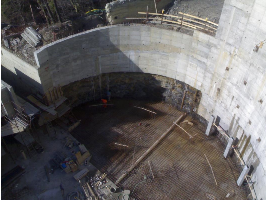
FOTO 05 - Marzo 2012 - Realizzazione di autorimessa interrata con riqualificazione del campo da calcio a Genova Oregina. Vista delle fondazioni a sostegno di rampa di accesso all'autorimessa. Si notano fronti di scavo di altezza pari a 24 metri eseguiti con paratie multitirantate..