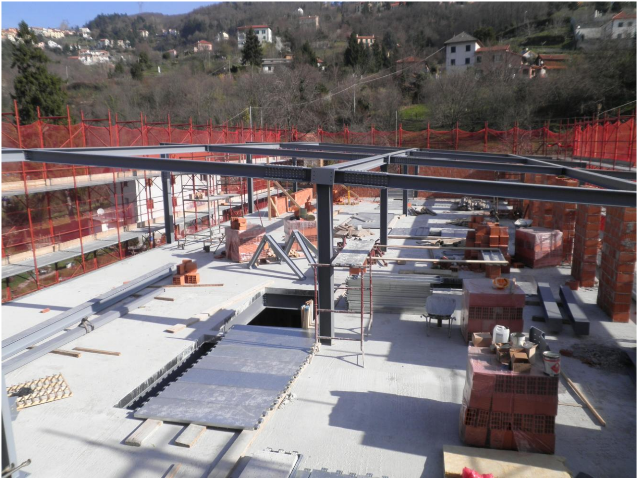
Foto 10 – Marzo 2012 – Sopraelevazione e cambio di destinazione d'uso dell'ex biscottificio Delfino a Mignanego. Strutture metalliche a sostegno della nuova copertura.