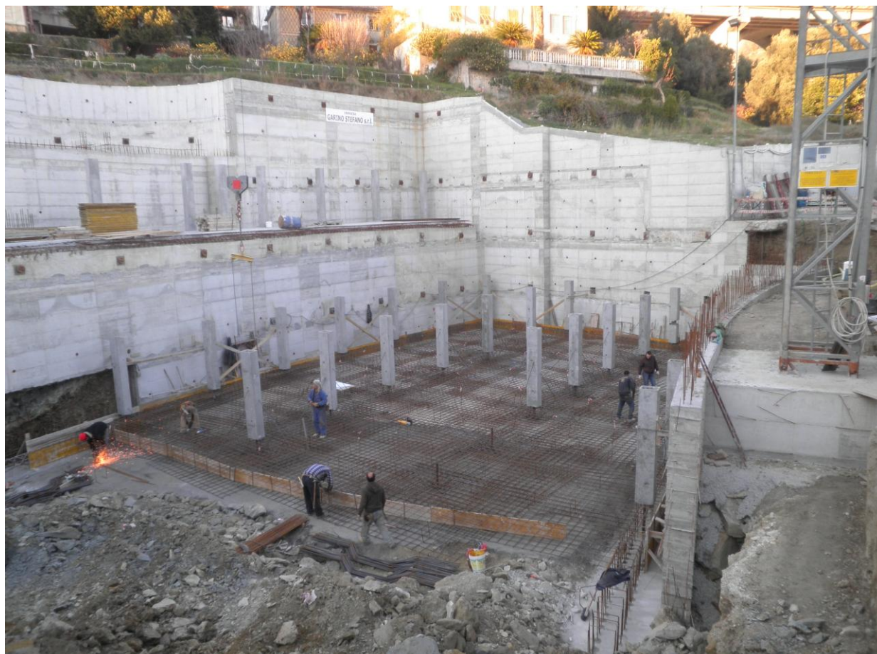
Foto 07 – Dicembre 2011 - Realizzazione di autorimessa interrata ed immobile residenziale ad Arenzano – Posa delle armature di fondazione del primo concio di edificio. Sullo sfondo paratie a più ordini di tiranti.