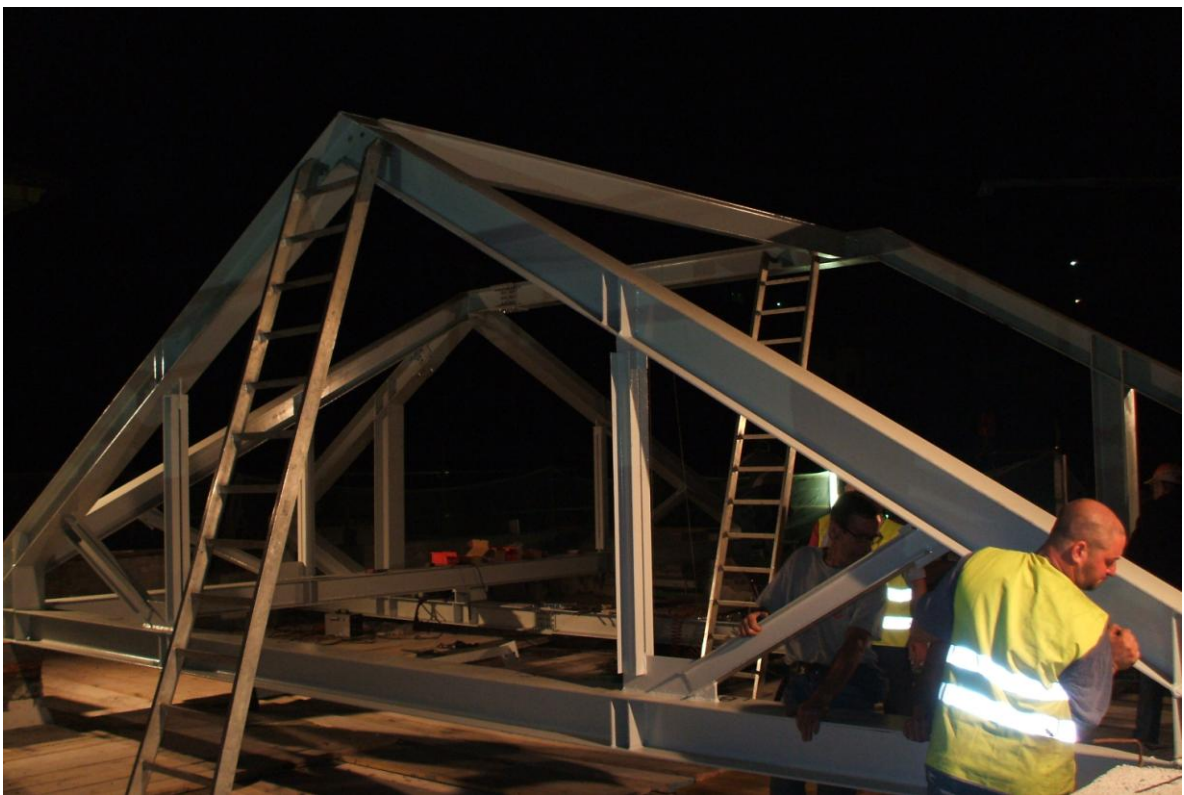
Foto 12- Luglio 2008: Interventi di sopraelevazione ristrutturazione Villa Scognamiglio a Rapallo – Posa delle capriate metalliche in notturna.