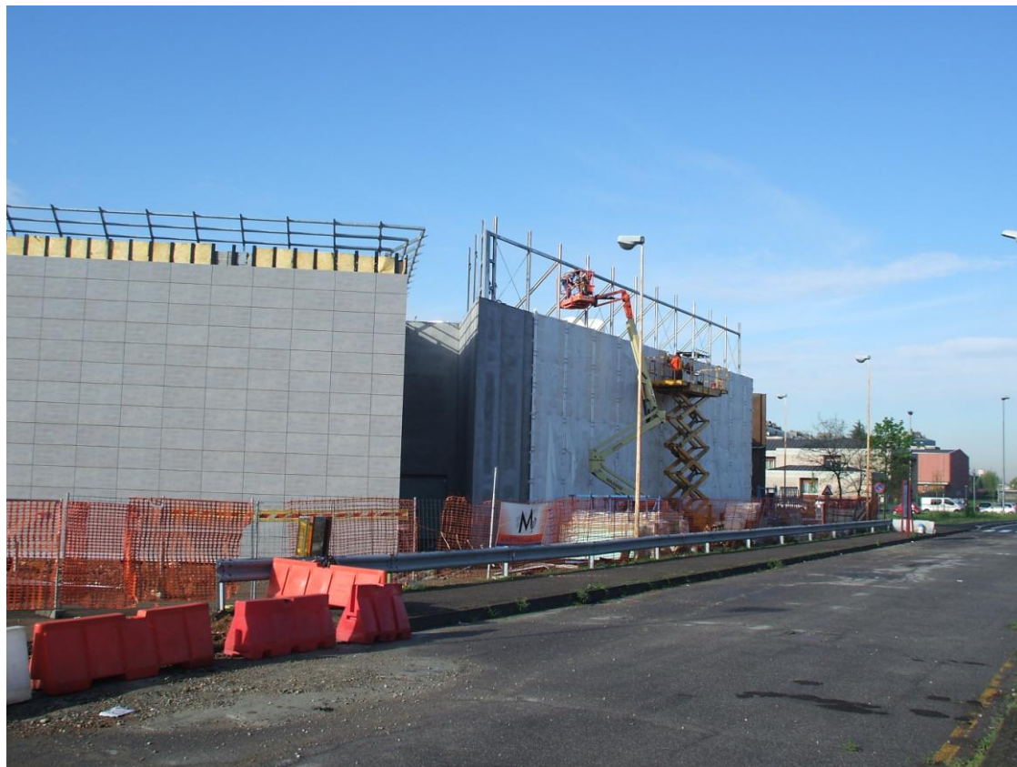
FOTO 01 – Luglio 2008 - Ampliamento e ristrutturazione del centro commerciale di Rhocenter a Rho (MI) – Nuovi corpi di fabbrica eseguiti con fondazioni indirette e strutture prefabbricate.

Si allegano alcune foto dei lavori più significativi progettati ed e diretti dal sottoscritto. Altre fotografie sono visionabili sulla galleria lavori del sito internet: http://studioraniericosta.it