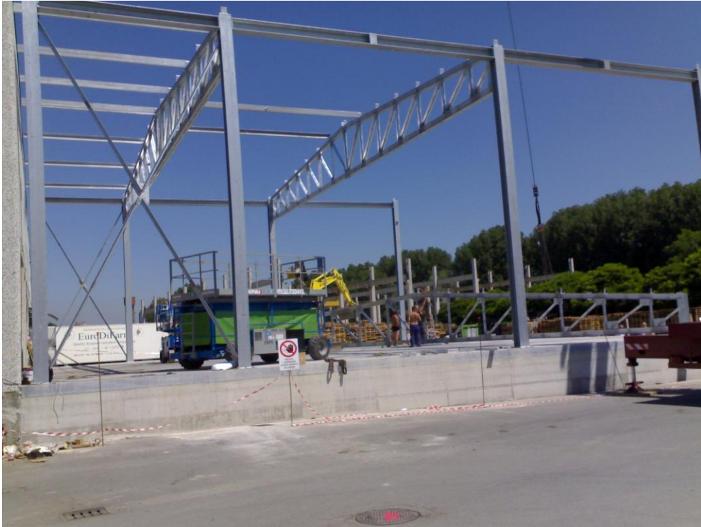
Foto 11- Luglio 2008: Realizzazione di capannone in acciaio a Casalmaiocco – Lodi. Particolare di posa delle capriate metalliche di luce pari a 24 metri.