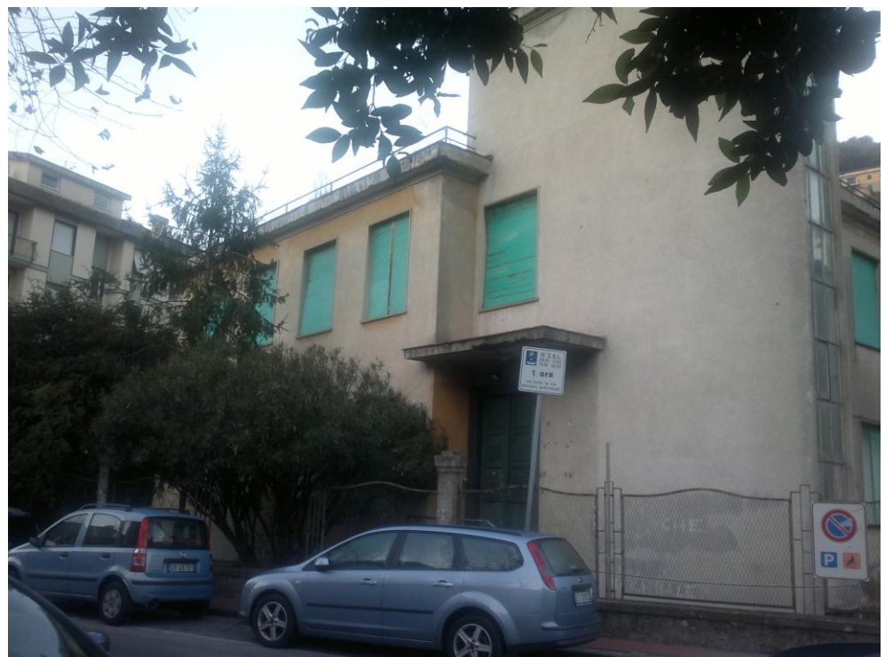
Foto 4 - vista dell'ingresso principale