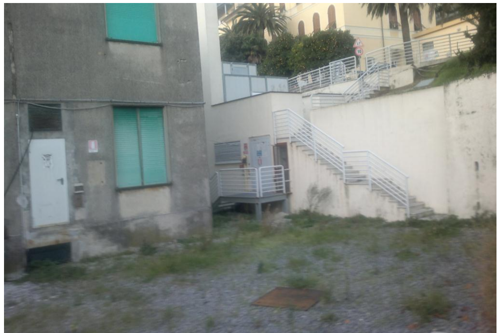
Foto 1 - cortile