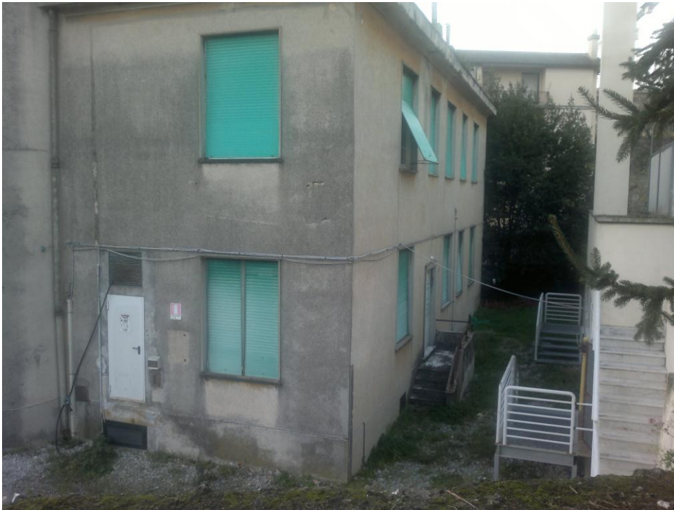
Foto 3 - vista del cortile sul retro