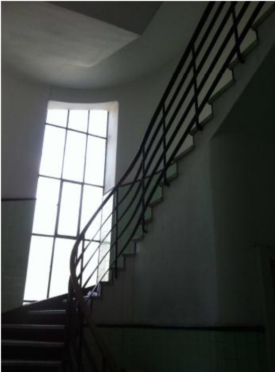
Foto 5 - vano scale