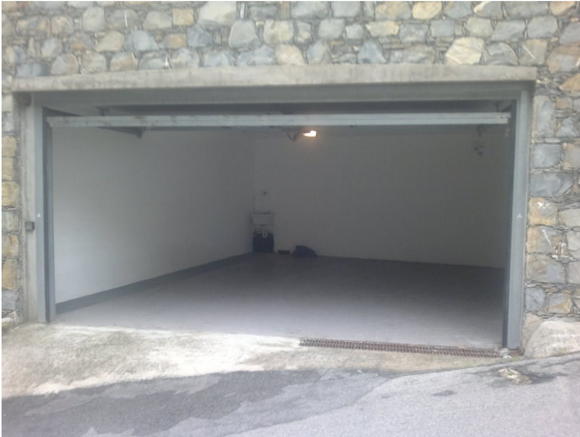
Foto 3 - Interno del box