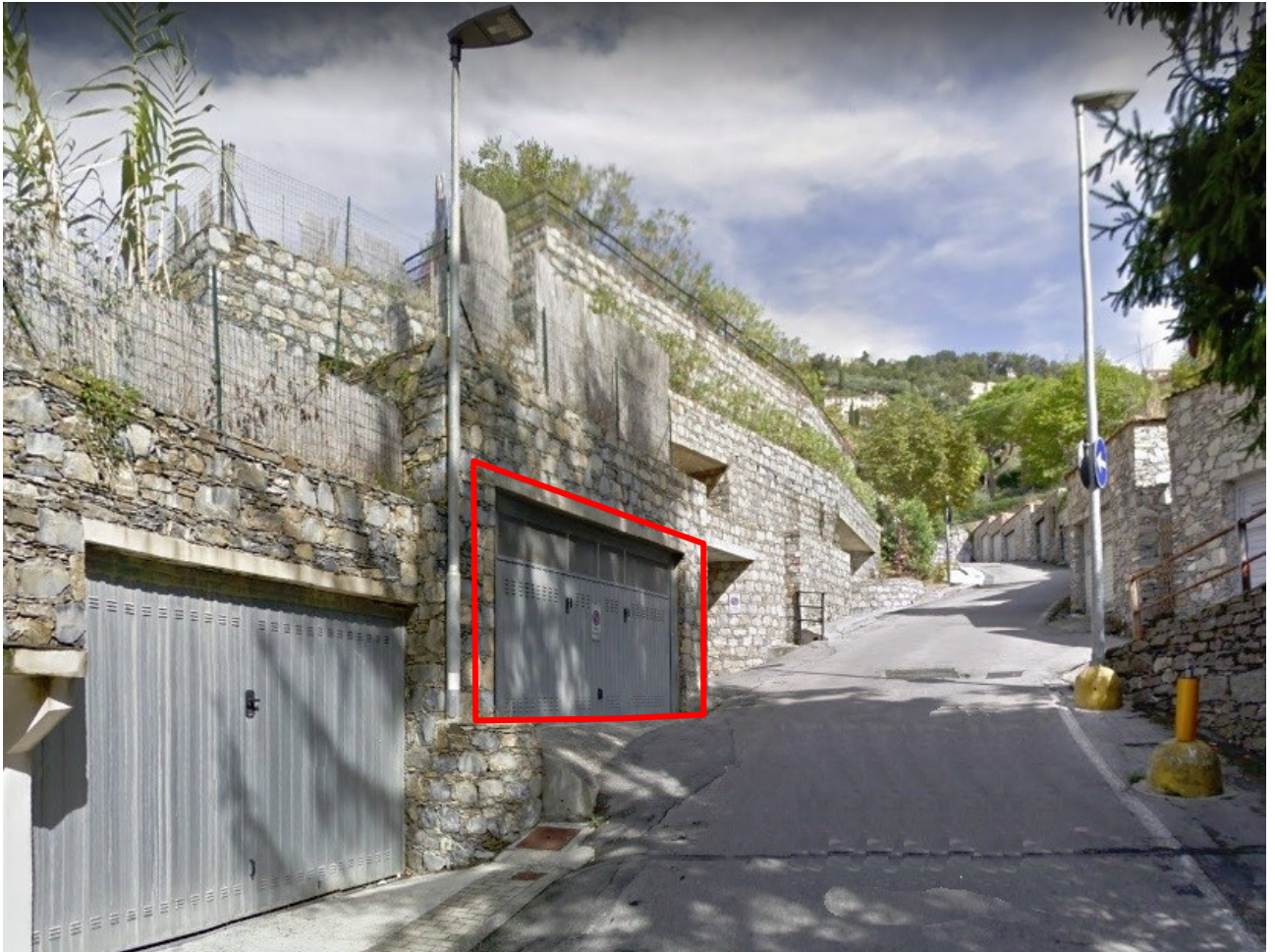
Foto 1 - Vista del box nel contesto condominiale dell'autorimessa