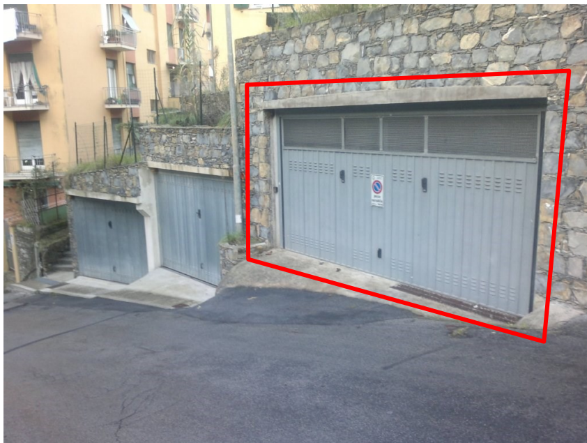
Foto 2 - Serranda basculante di ingresso al box