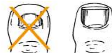
Come tagliare le unghie