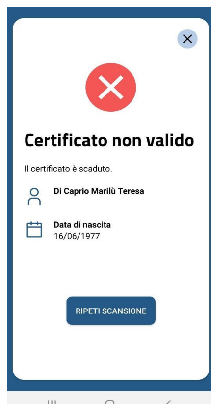
Figura 7 Schermate Verifica C19 - QR code validato correttamente ma scaduto