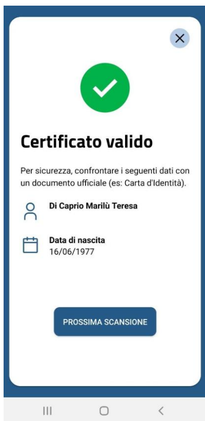
Figura 5 Schermate Verifica C19 - messaggio di conferma per QR code validato correttamente