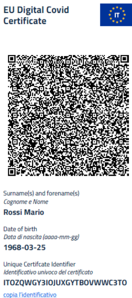
Figura 10 Schermata app IO - visualizzazione certificazione verde COVID-19