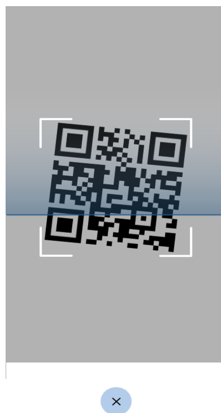
Figura 3 Schermate Verifica C19 - scansione di un QR code