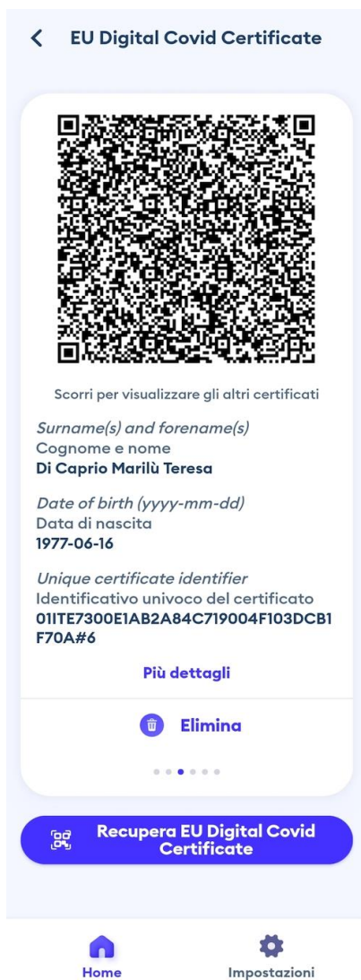
Figura 9 Schermata app Immuni - visualizzazione certificazione verde COVID-19

Nelle figure 9 e 19 viene mostrato come l'utente visualizza la propria certificazione nelle app.