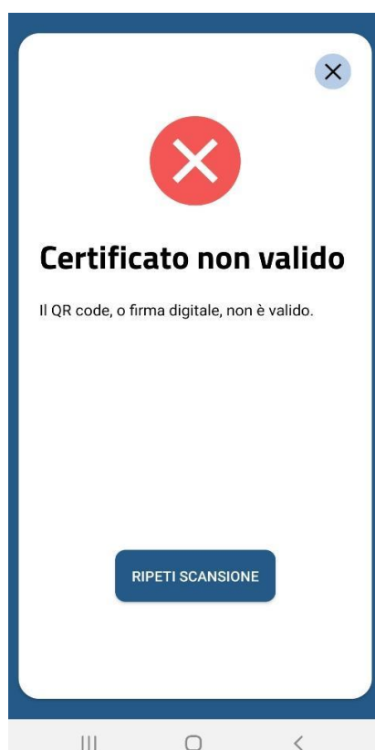
Figura 6 Schermate Verifica C19 - QR code non validato per formato errato o firma non valida