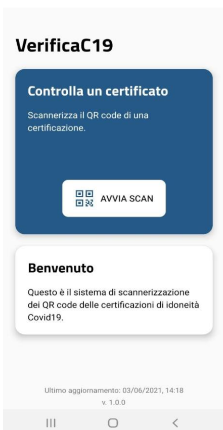
Figura 4 Schermate Verifica C19 - Home

Nelle figure seguenti vengono mostrate le schermate principali di VerificaC19